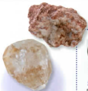
直径4cmはある大粒のハーキマーダイヤモンド。こんな石がセドナにはゴロゴロしている場所もあるとか。まさに宝の山！